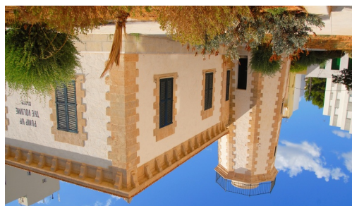
Far de ses Coves Blanques