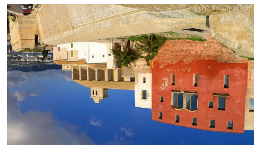
Castell d'Eivissa