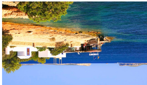
Aquarium Cap Blanc