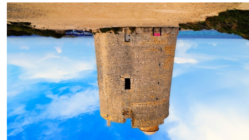
Torre de ses Portes