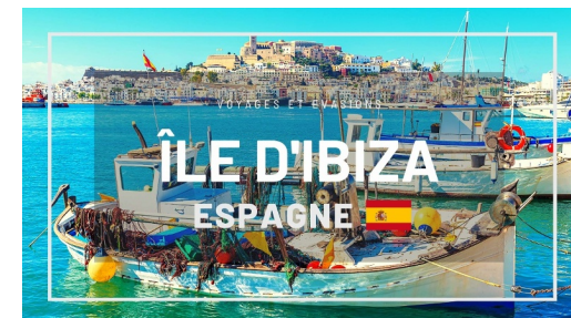
Île d'Ibiza (Espagne)