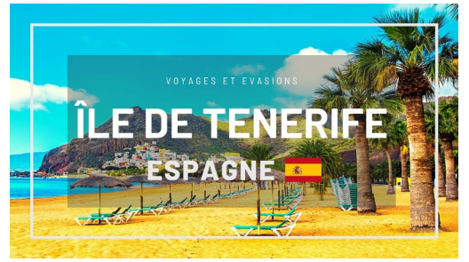
Île de Ténérife ( Ténérife )