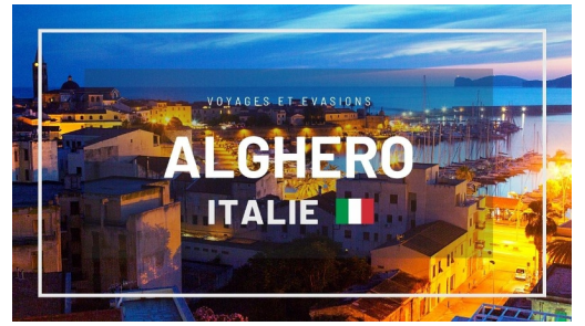
Alghero (Italie)

Visite guidée et numérotée de la ville d'Alghero (Italie) Point de départ de l'activité Cattedrale di Santa Maria, Piazza Duomo, 2, 07041 Alghero SS, Italie Point d'arrivée de l'activité Diocèse d'Alghero-Bosa, Via Principe Umberto, 7, 07041 Alghero SS, Italie