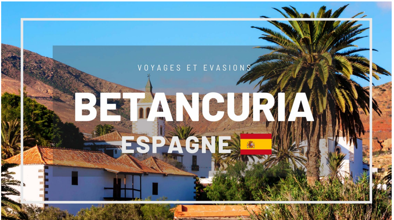
Betancuria ( Fuerteventura )