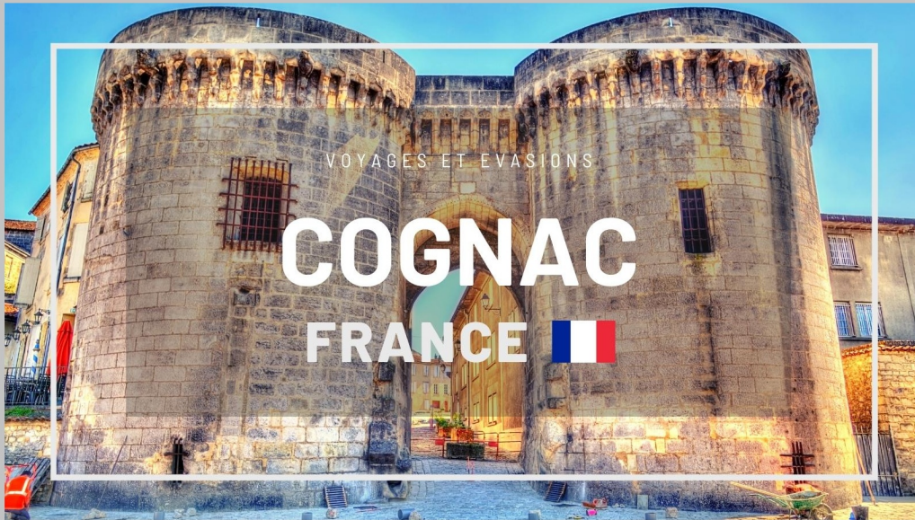
Cognac ( France )