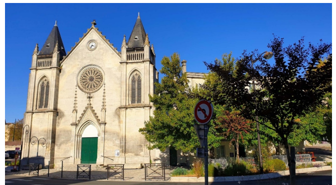
Eglise Saint Jacques