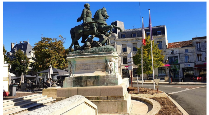
Statue de François 1er