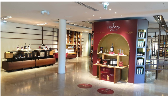
Les Visites Hennessy