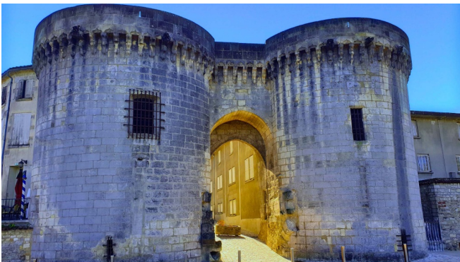
Porte et tours du Vieux-Port de Cognac