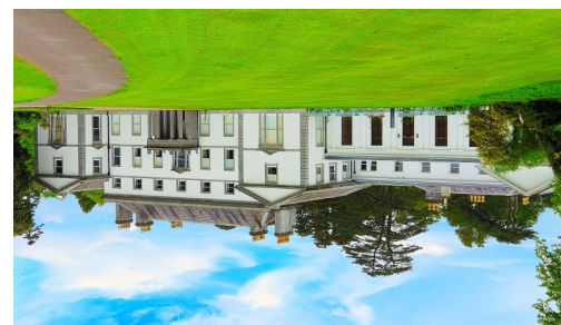
Fota House