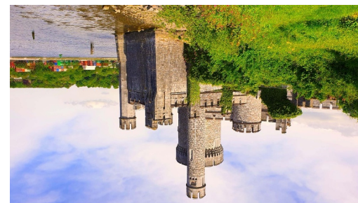
Blackrock Castle Observatory