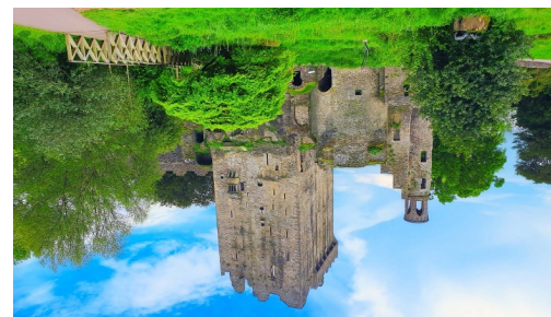
Blarney Castle