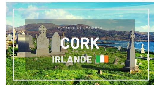
Cork et ses environs (Irlande)

Point d'arrivée de l'activité The Counting House, S Main St, Centre, Cork, Irlande