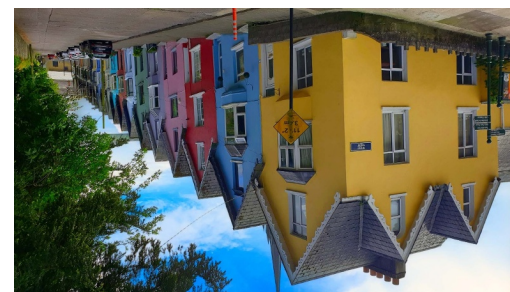
Deck of Cards Houses