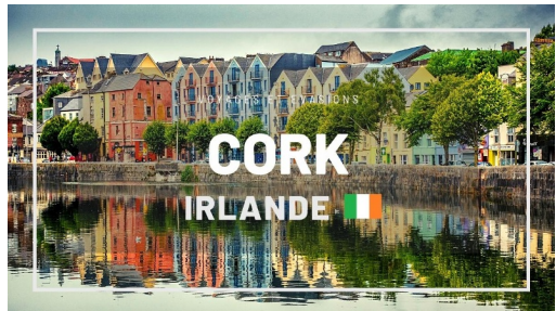
Cork (Irlande)

Point d'arrivée de l'activité The Counting House, S Main St, Centre, Cork, Irlande