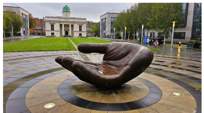
The Wishing Hand