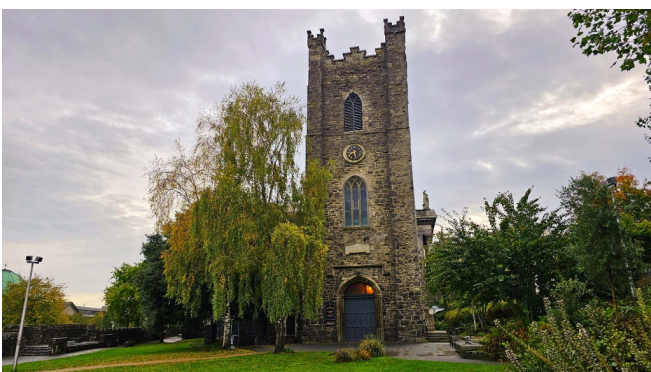
St. Audoen's Church