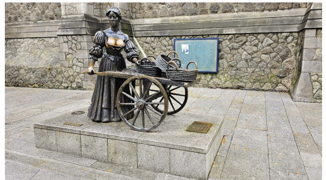
Molly Malone Statue