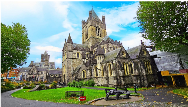
Christ Church Cathedral