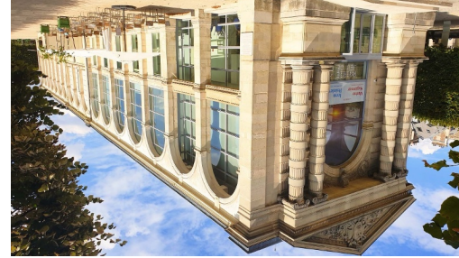
Jeu de Paume