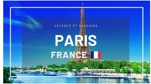
Paris ( France )