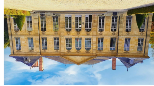
Musée Rodin