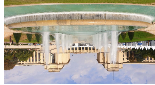
Fontaine du Jardin du Trocadéro