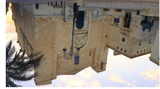
Església del Carme