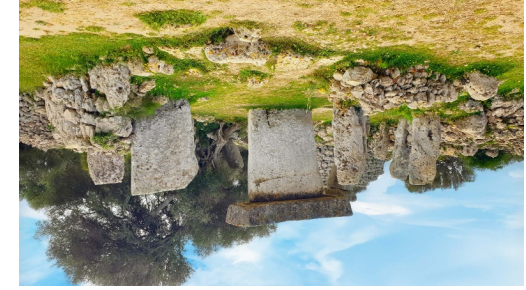
Poblat talaiòtic de Tàst de Dalt