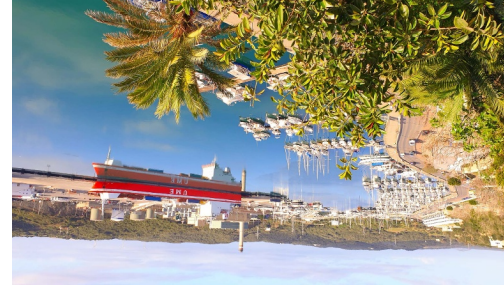
Panorama Santa Francesc