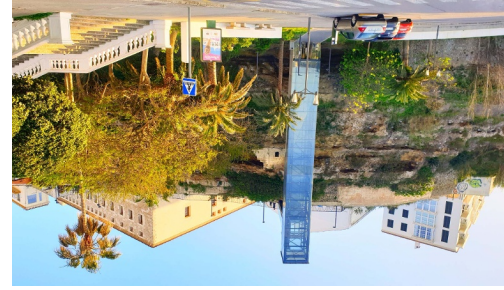
Ascensor port de Maó