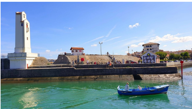
Phare de Saint-Jean-de-Luz