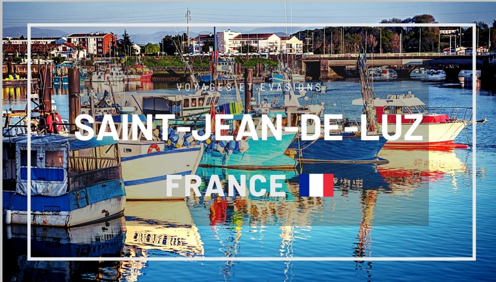
Saint-Jean-de-Luz ( France )