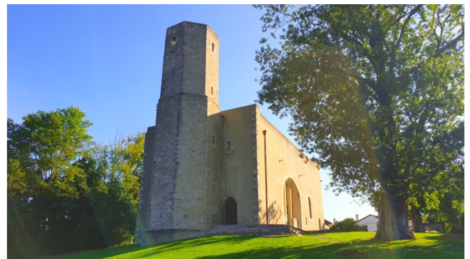
Tour De Bordagain