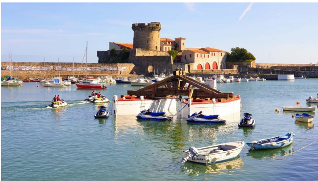
Fort de Socoa