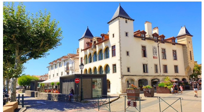
Maison de Louis XIV